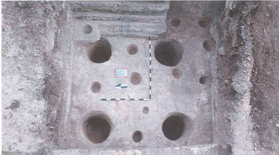
Figura 1. Cosmograma identificado en la excavación de la unidad 50A-30 en el sitio arqueológico Naranjo, Petén, Guatemala (Fotografía. Suarlin R. Cordova 2021).