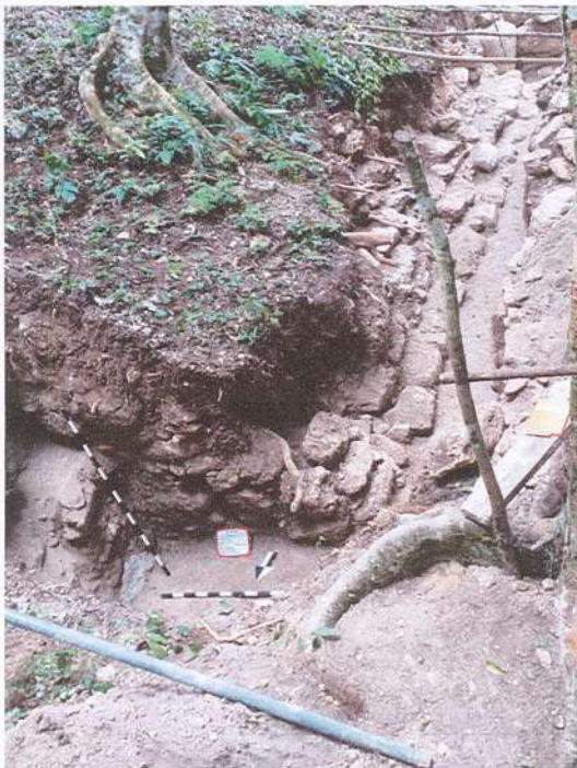
Figura 3. Limite norte de las escalinatas principales de la Estructura B20