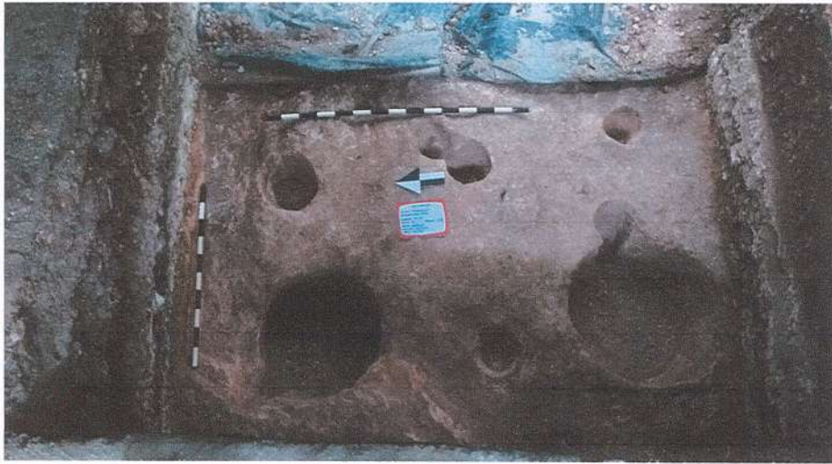
Figura 2. Chultunes 5 y 6 localizados en la extensión oeste de la suboperación 50A-30 en el sitio arqueológico Naranjo, Petén, Guatemala.