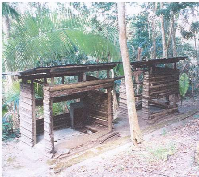
Figura 4. Área de sanitarios del sitio arqueológico El Pilar, Petén, Guatemala (Fotografía. Suarlin R. Cordova 2021).