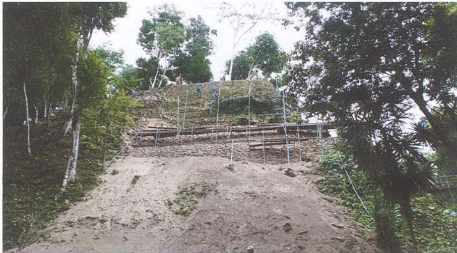
Figura 2. Restauración de los cuerpos del basamento de la fachada norte de la Estructura B24.