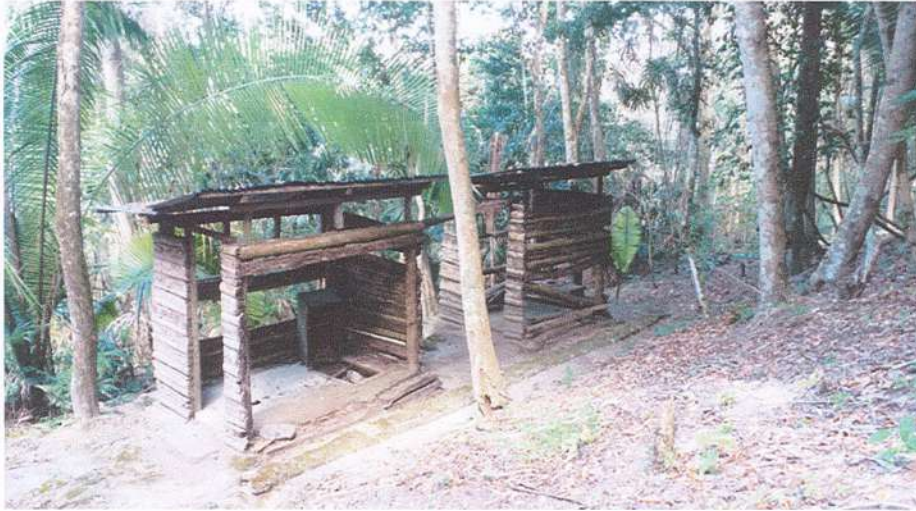
Figura 1. Estado actual del área de sanitarios del sitio arqueológico El Pilar, Petén, Guatemala (Fotografía. Suarlin R. Cordova 2021).